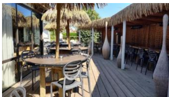
Attention, nombre limité à 50 personnes.